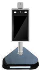
H38xW260xD283mm 参考価格:12,000円(税抜) 卓上スタンド(別売)